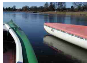
Am 13. März dann im nochmal gefrorenem See das anpaddeln.