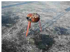
Kalte Würste werden heiß gegrillt.