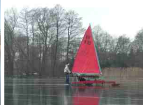
Die Flotte wurde vergrößert. Der Nachbar hat einen neuen.