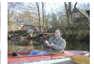
Beim Eisanpaddeln lässt der Dompteur eine Ente über sich fliegen.

Der in DKSZ angezeigte Termin zur Paddeltour muß um eine Woche vorverlegt werden. Statt des angesagten Datums: 19.7. erfolgt die Paddeltour am: SAMSTAG d. 12. Juli 2003 um 9 Uhr ab Preetz