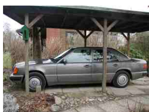
Letztes Bild vom: ALTEN