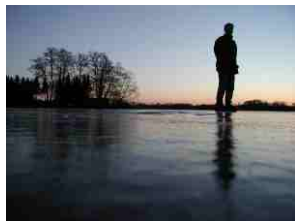
Am Horizont die Eisstatue vom Dieksee.