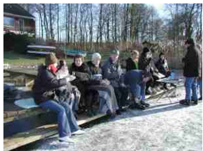
Viel Volk versammelt sich zum PUNSCH