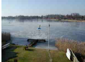
Hier unser grosses EISSTADION

Wer hätte das denn gedacht. Kaum war die Diekseezunge Nr. 29 einige Tage alt da wurde der Frost noch einmal so stark dass der schon aufgetaute See wieder fast ganz zufror und wir doch noch eissegeln konnten. Aus Sicherheitsgründen liefen wir zwar nicht mehr auf die andere Seeseite oder nach Malente aber in die Nachbarbucht und bis zur Schwentinedurchfahrt war es kein Problem. Das war gaz toll. Und eine Menge Volkes versammelte sich um nun doch noch in dieser Saison den See zu genießen sogar mit Punsch und offenem Grill auf dem Eis.