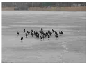
Der Hungermarsch der Zappen auf dem Eis.

Wie schon vor 6 Jahren kam nun für die ZAPPEN(Teichhühner) eine schwere Zeit. Kein Wasser, Boden gefroren und Schnee drauf. Also nichts zu fressen. So zogen diese sonst sehr scheuen Tiere in Kolonnen über die Strassen auf Nahrungssuche zum Teil schon sehr geschwächt und humpelnd. Sie nahmen, was sie sonst nie tun von uns Futter an. Grünzeugs und Reste.