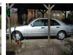
Erstes Bild vom: NEUEN