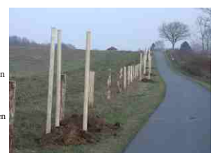
Unser neuer Radweg (Siehe DKZS Nr.29) wird jetzt "BEBAUMT"