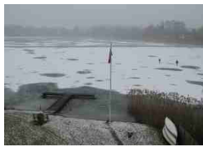
Am 4. März war dann die letzte Eisbegehung der Frühjahrssaison.