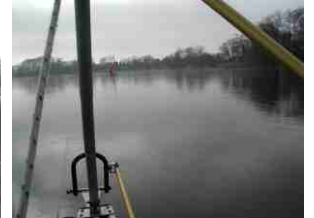
Der Blick aus der Kanzel während des Fluges.