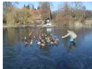
Auch Enten und Zappen kommen nicht zu kurz.