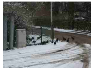
Dann kam noch einmal Schnee und die Zappen hatten es schwer.