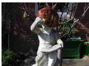
Der "LESENDEN" Nachbarin wachsen "Gottseidank" wieder Haare.

DONNERSTAG : 1. Mai Fahrradtour zum BUNGSBERG