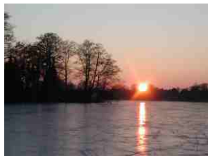
Die Sonne wandert schon wieder sichtbar nach rechts.