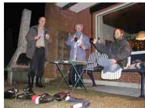
Am 28.2. wurde die Grillsaison eröffnet.