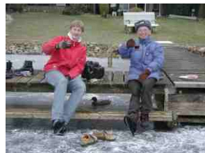
Zwischen den Laufunden eine Punsch Anheizung.