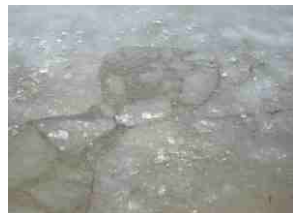
Am 8. März ein missglückter nochmaliger Begehungversuch.