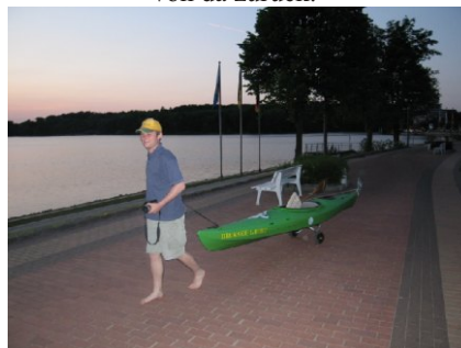
Bild unten: Das Boot DIEKSEEGEIST wurde umgelagert von Timmdorf nach Malente. Dafür kam das RESERVEBOOT von da zurück.