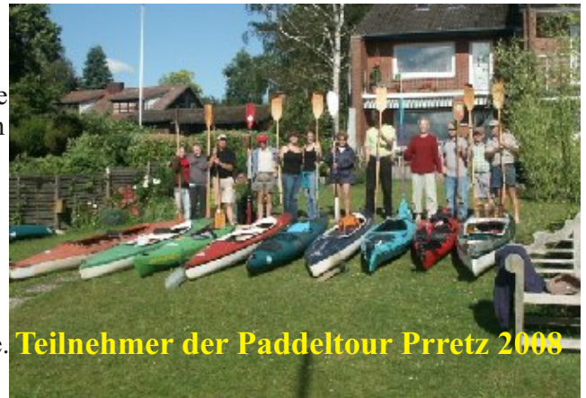
Teilnehmer der Paddeltour Preetz 2008

Nun ist es schon so weit dass auf einem PKW 3 Boote transportiert werden müssen. Allerdings geht das wirklich nur auf kurzen Strecken wie hier im Juli 08 zur Paddeltour von Preetz nach Malente.