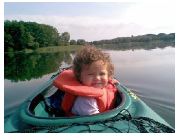
Linkes Bild: Unsere jüngste Paddlerin ohne Scheu auf ihrer ersten größeren Tour.