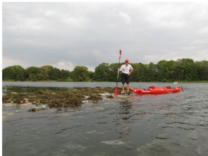
Bild links: Plötzlich über Nacht entstand eine neue Insel mitten im Langensee.

Bei der Teilnahme an der DIEKSEE REGATTA machten wir zwar nicht den 1. Preis aber wir ergatterten die beliebte Wurst.