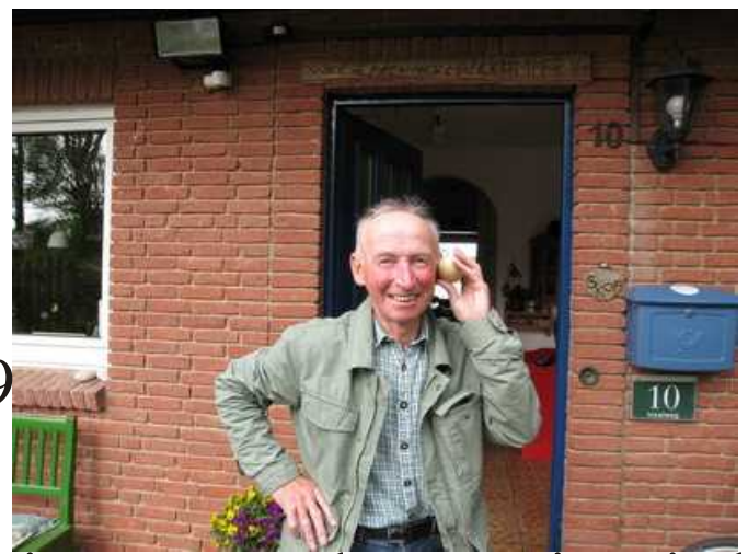
Meine Mutter hört mein Ei ab.