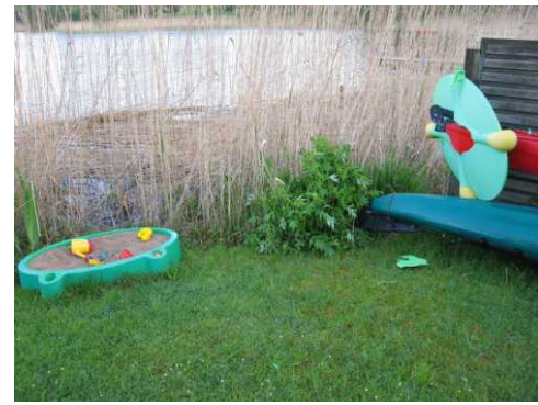
Am 8.5. Um 20 Uhr fegte ein kleiner Orkan über unsere Boote ließ, sie kentern und hob ein Paddelboot über den Zaun wo es beim Nachbarn im Schilf landete. Ein Sandkistendeckel flog gegen ein Paddelboot und bohrte sich tief in die Spitze hinein.