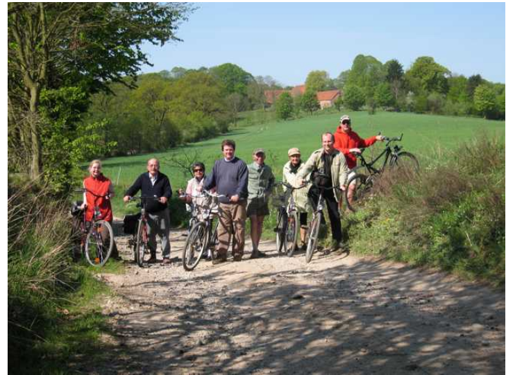
Erster Mai Bungsberg Tour mit einigen Aktiven. Nachmittags dann zum "Boote raus" mit Grillung, waren es mehr.(Leute)