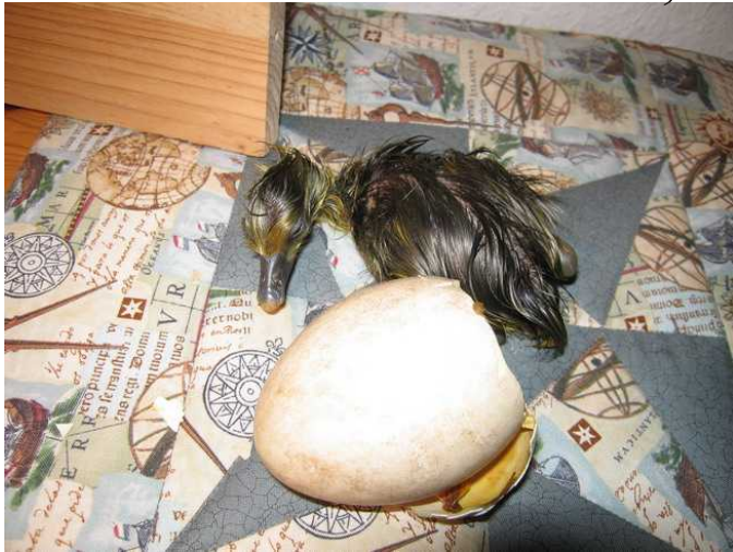
Ich habe es fast geschafft.