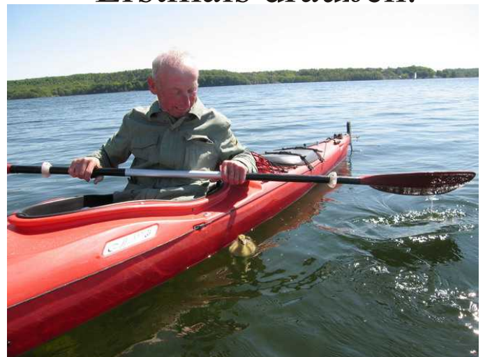
Bin überall dabei.