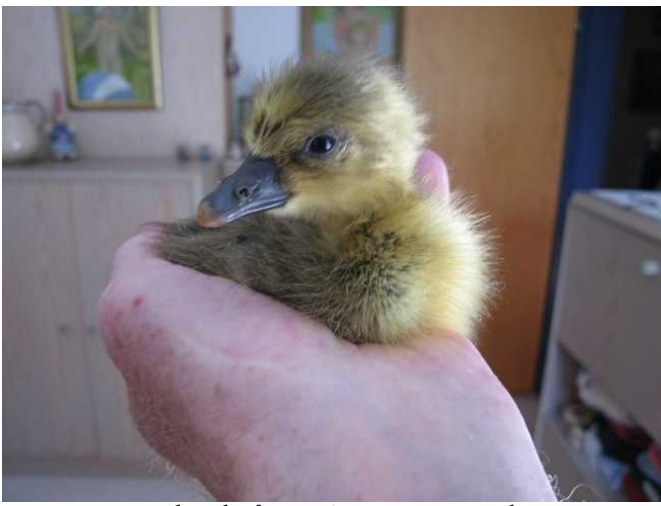
Ich bin 1 Tag alt.