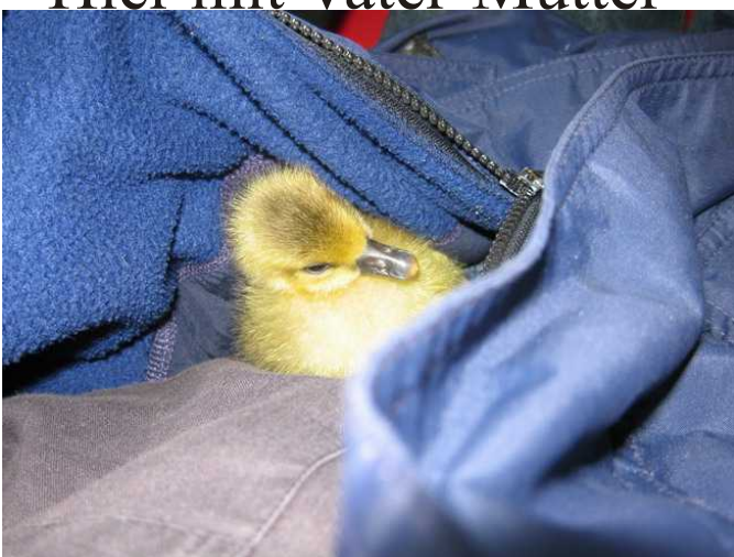
Bin gern unter der Jacke.