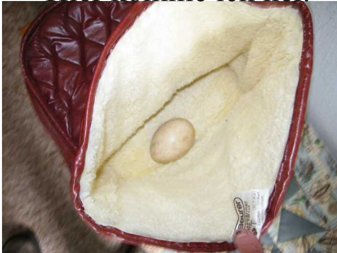
Das ist mein Brutsack,