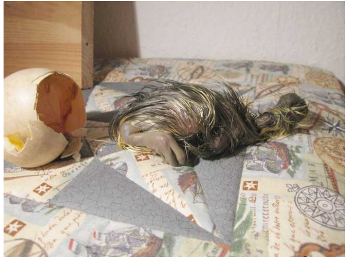
Das war anstrengend.