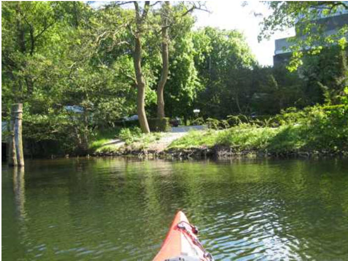
Eine Demo ist nun nicht mehr nötig. Hier an dieser Stelle in der Malenter Bahnhofsbucht soll ein Anleger entstehen.