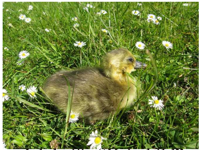
Ich heiße "Krimhild"