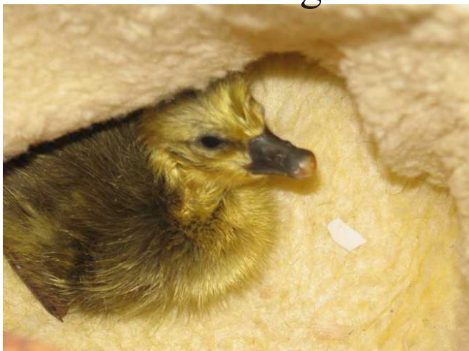
Ich trockne im Brutsack.