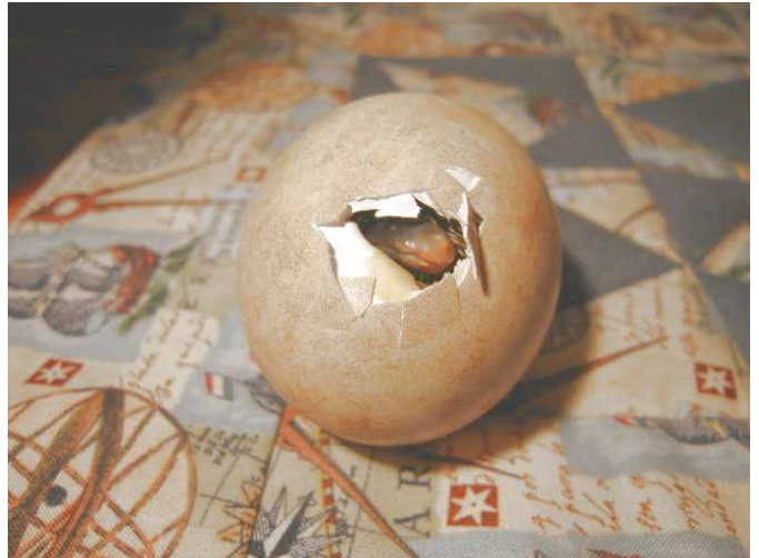
Jetzt will ich aber raus.