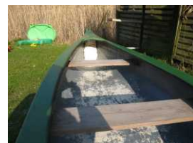
Nachdem im vergangenen Jahr das Kanu bei einer Übung unterging machten wir es jetzt mittels Ausschäumung am Bug und Heck schwimmbar-