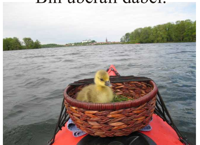
Meine 1. Ausfahrt nach Plön.