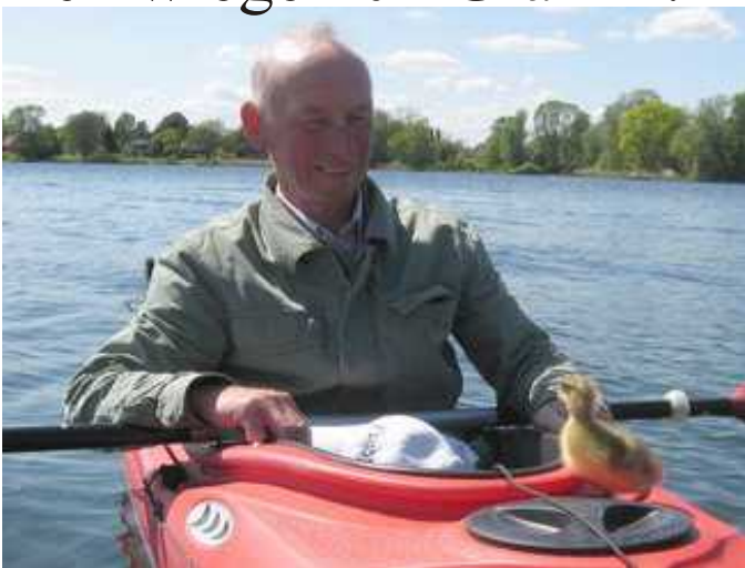
Hier mit Vater-Mutter