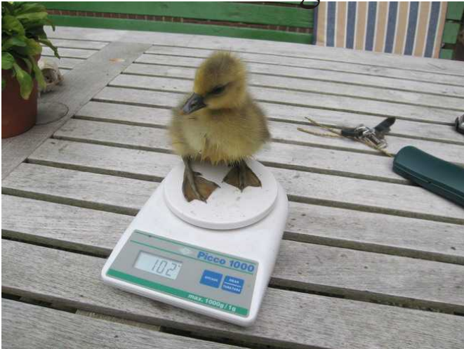
Ich wiege 102 Gramm.