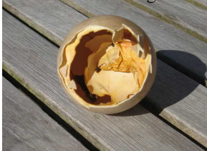
Das war mein Ei.