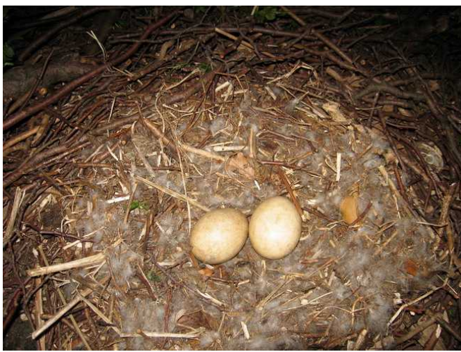
Hier komme ich her.