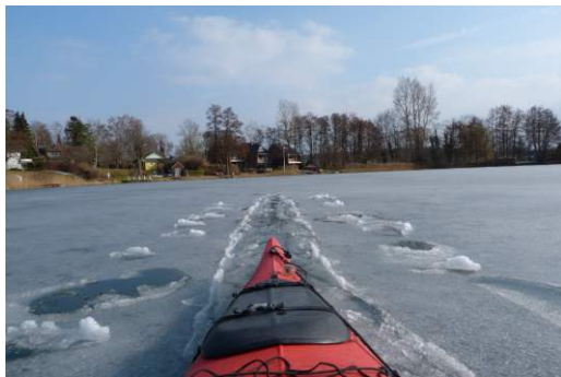
9. April. Bootsgasse durch das Eis.

Im Laufe des Jahres folgten dann die beliebte Preetz Tour an der einige Neulinge teilnahmen sowie mehrere Touren nach Kiel. Unter anderem beteiligten wir uns da auch an der "Schwentine Wandertour". Die große Jahrespaddeltour startete in Vissy Brod in der Tschechei und führte die Moldau hinunter, über Prag und dann die Elbe abwärts. Über diese schöne interessante Tour gibt es einen extra Bericht. Außer unzähligen anderen kleinen oder größeren Wandertouren in unserem eigenen Revier konnten wir sogar noch, allerdings mit kleiner Besetzung, an der Dieksee Segel Regatta teilnehmen.