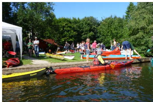
Ankunft der Schwentine Wanderfahrer in Klausdorf