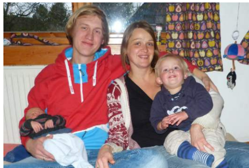
Mitgliederzuwachs: ANTON-JOTUN. Glückwunsch.