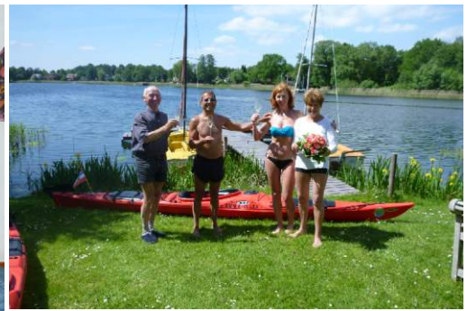
Bootszuwachs. Taufe der EMMA CLARA