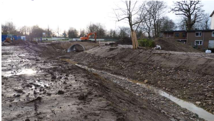
Sohlgleite Eutin im Bau. Jan.2016

Nachdem in Spitzenort, Plön Ölmühle und Malente in der Schwentine Sohlgleiten gebaut wurden, ist man gerade jetzt dabei auch eine solche in Eutin zu bauen. Während man allerdings bei den vorgenannten Übersetzstellen an die Boote gedacht hat, ist dies bei letzterem Vorhaben leider nicht der Fall. Im Gegensatz zu vorher ist dort sogar die Übersetzstrecke nun noch länger. Apelle seitens unseres Vereines und des Bootsvermieters in Eutin blieben unbeachtet. Es wäre keine Schwierigkeit gewesen dort parallel zum Weg Bootsrollen zu bauen. Die Kosten dürften bei dem enormen Projekt für diese Sache sicher nicht all zu sehr ins Gewicht fallen. Uns Paddler nicht, aber viele andere Wasserwanderer schreckt es ab mit den schweren Kanus, diese tragend, nach Eutin zu kommen. Da Malente ja auch durch eine fehlende Anlegestelle Wassersportunfreundlich ist, erfreut sich Plön immer mehr unseres Zuspruches denn dort ist alles vorbildlich gebaut!