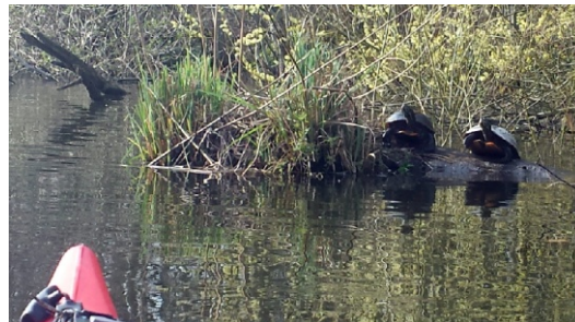
Bei einer der Paddeltouren nach Kiel sahen wir mehrfach in der Schwentine die hier beheimateten Sumpfschildkröten welche wir auch schon in der Eider und im Oberlauf der Schwentine sichtigten.