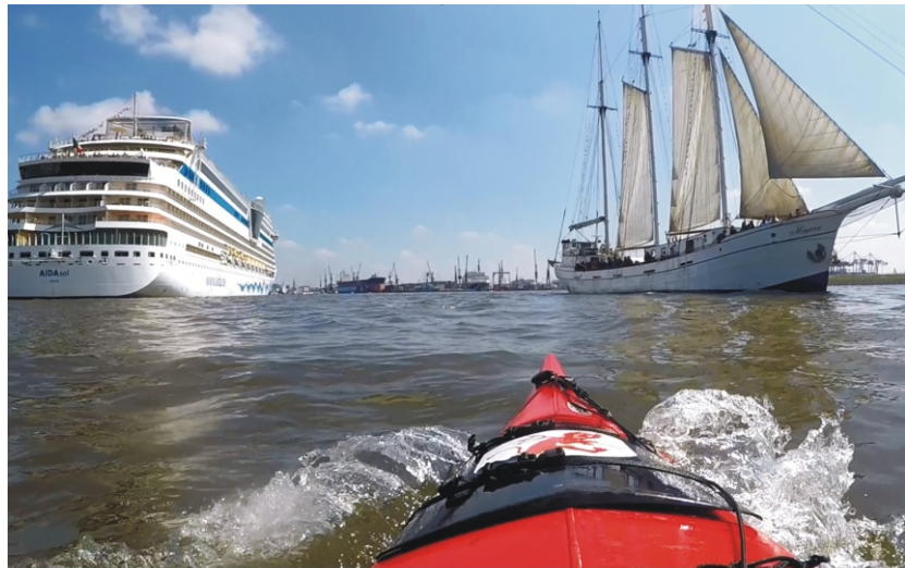
Begegnung: AIDA - DIEKSEETEUFEL - MINERVA Hamburg-Elbe - 7.5.2017

Bei einer kleinen privaten Trauerfeier gedachten wir Ihrer.