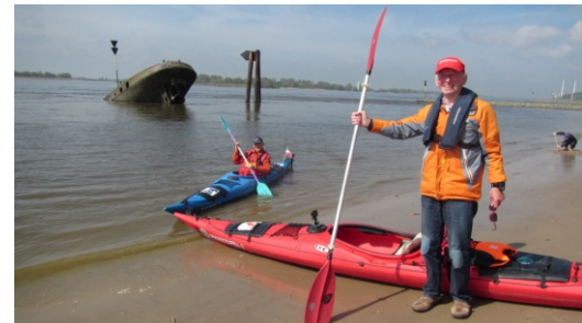
Auf unserer Paddeltour anlässlich des Hafengeburtstags in Hamburg waren wir nicht nur mitten drinnen in der Auslaufparade wie man im Bild ganz oben sehen kann, sondern wir konnten auch beim Start in Blankenese, hier im Bild, ein Schiff versenken.