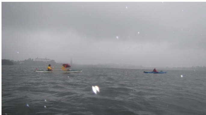
Bei starkem Wind, großem Wellengang und Dauerregen fährt der Rest der verbliebenen Mannschaft der Preetz Paddeltour über den großen Plöner See und "versammelt" sich dann zum "Gruppenbild" am Ziel.