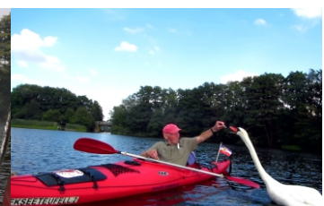
Schwäne fordern jetzt Brückenzoll