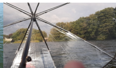
Der neue amtliche Segelschirm