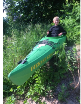
Der Diekseegeist hat eine neue Heimat gefunden.

In Ausgabe 68 wurde berichtet, dass die Rollenanlage in Malente falsch erneuert ist. Nun hat man sie geändert.