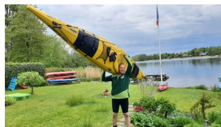
Es gibt Leute die können 1 Paddelboot mit nur einer Hand transportieren.

Die einzige Tour mit mehreren Teilnehmern war in 2021 unsere beliebte Fahrt Preetz- Malente.