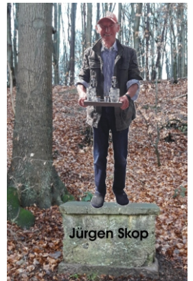
Dieses Standbild wurde am Ukleisee entdeckt.