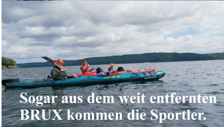
Sogar aus dem weit entfernten BRUX kommen die Sportler.