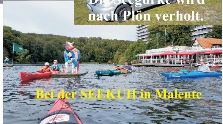
Bei der SEEKUH in Malente