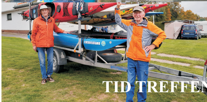
TID TREFFEN IN BEVERUNGEN