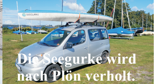
Die Seegurke wird nach Plön verholt.