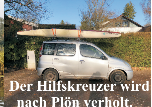
Der Hilfskreuzer wird nach Plön verholt.